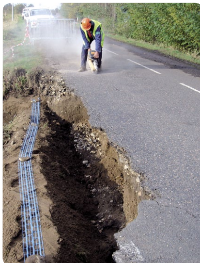
Réparation d'une conduite d'eau à St Laurent la Conche, après les crues de novembre 2008

Pour répondre aux impératifs économiques et environnementaux de ses clients, Saur développe des techniques innovantes et performantes. Son rapprochement avec le groupe Sécché Environnement en 2007 fait de Saur un Groupe National, totalement engagé dans l'environnement.